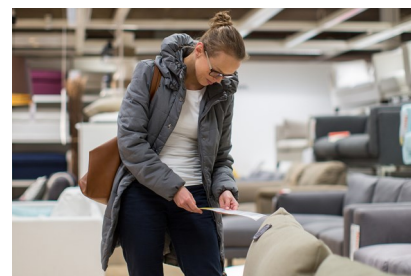
Besoin d'un nouveau salon ?